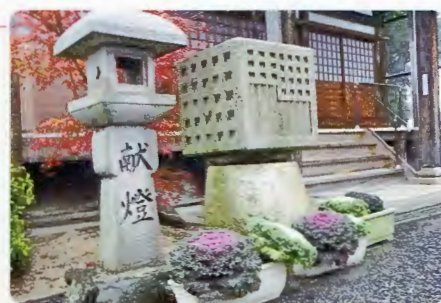
新たに植替えた葉ボタン 大原市場補陀楽寺