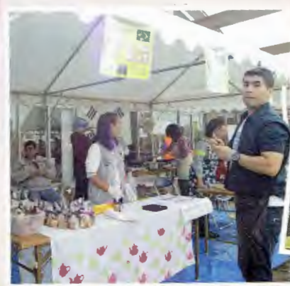
ブラジルのデザート販売