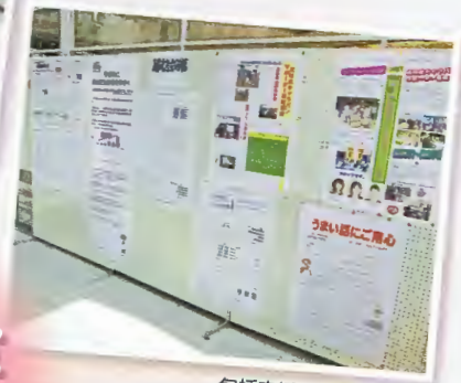
包括支援センターだより