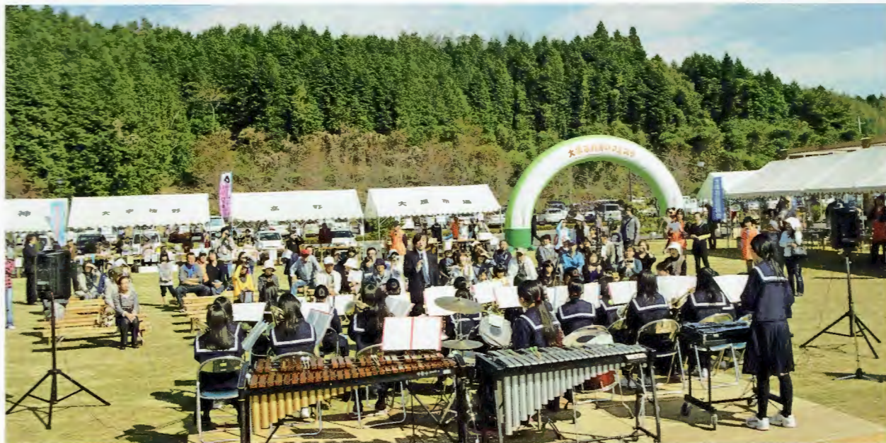
甲賀中学校ブラスバンドの皆さん