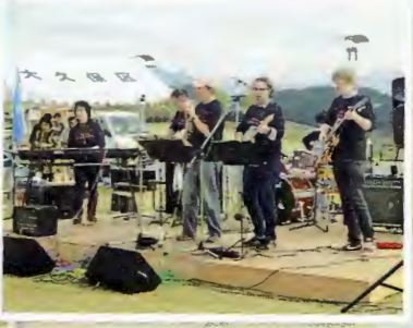
英語の先生たち「和daAffair」演奏