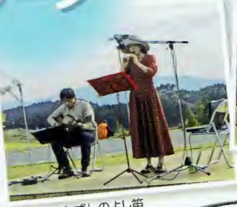
「はなちゃんず」のよし笛