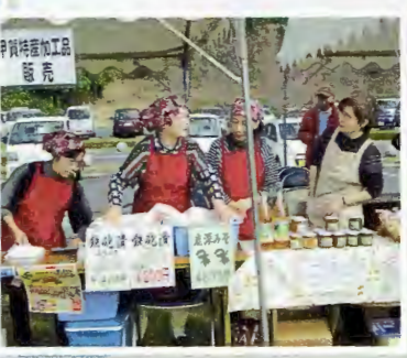
特産加工販売グループ