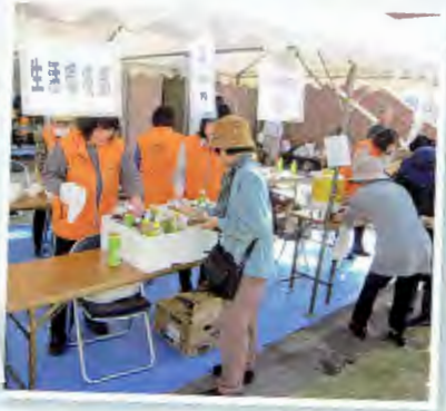
生活環境部会出店