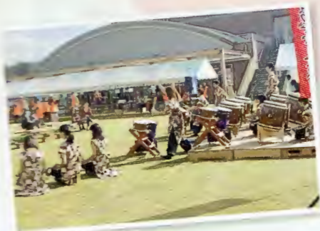
開会を告げる忍玉太鼓