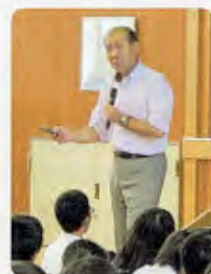
甲賀中学校人権学習