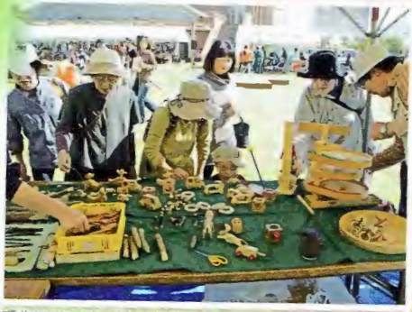
手作りオモチャの木工作販売