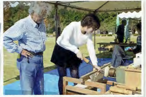
難しい?木地師体験