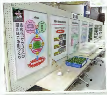
滝区「ササユリ事業」活動