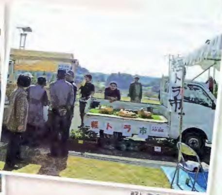
軽トラの上の野菜市