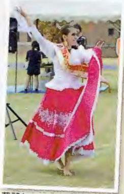
華麗なマリネダンス (ペルー)