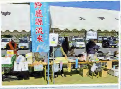
名だたる鈴鹿源流米