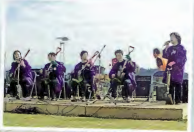
「シャベラース」のスコップ三味線