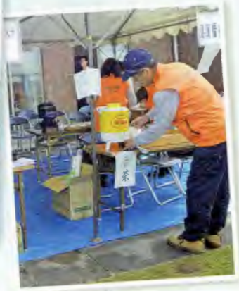
健康福祉部会出店