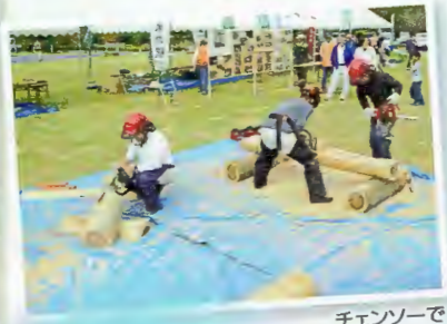
チェンソーで ペンチ作り