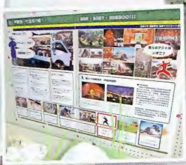
近畿大の竹プロジェクト