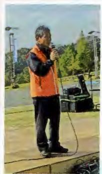
フェスタ実行委員長 開会挨拶