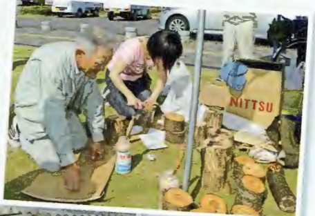
キノコ植菌・販売