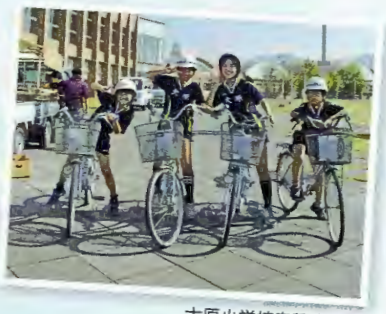
大原小学校自転車競技