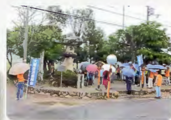
あいにくの雨…諏訪神社