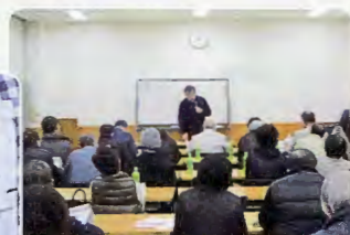
高齢者見守り講座