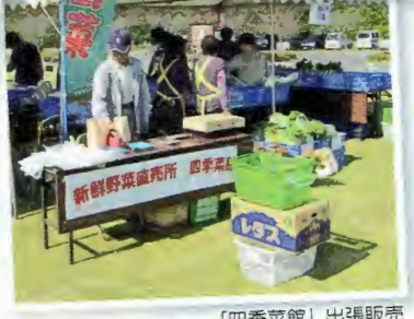
「四季菜館」出張販売