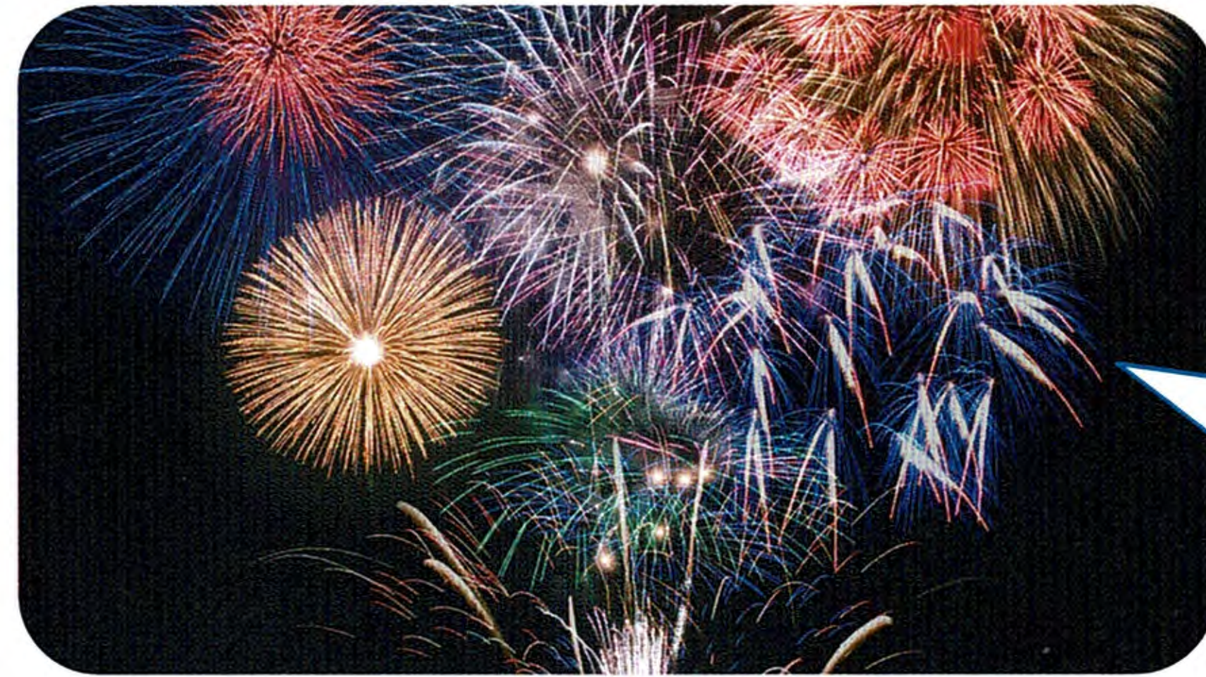
PLの花火？ 神の花火も負けへんで！