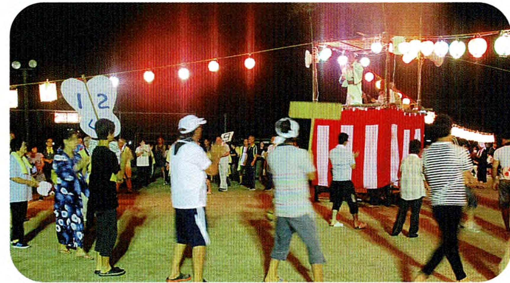
盆踊りコンテストを楽しむ