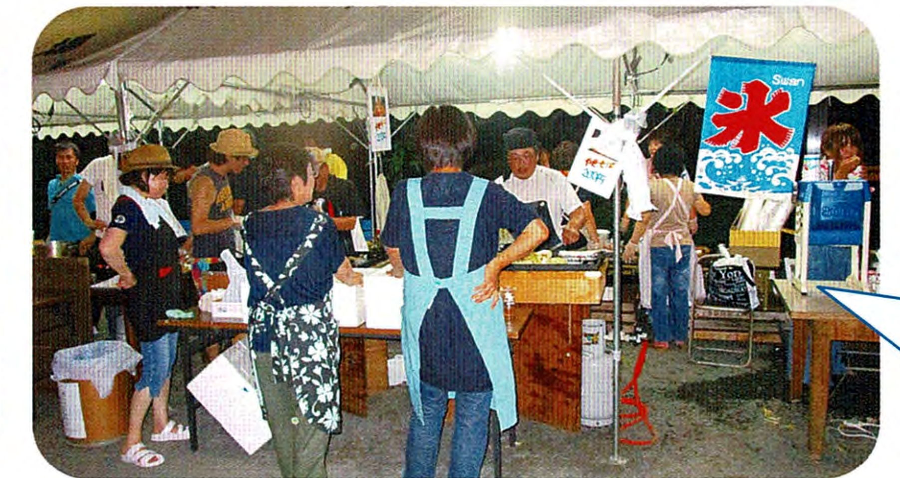
おおにぎわいの各種模擬店