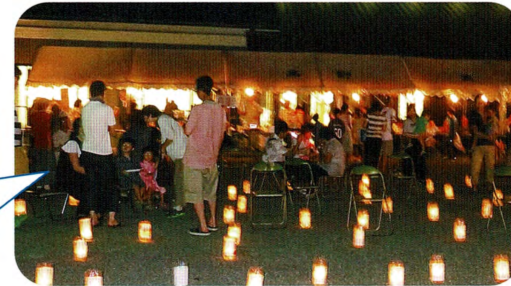
手作り灯籠が灯される