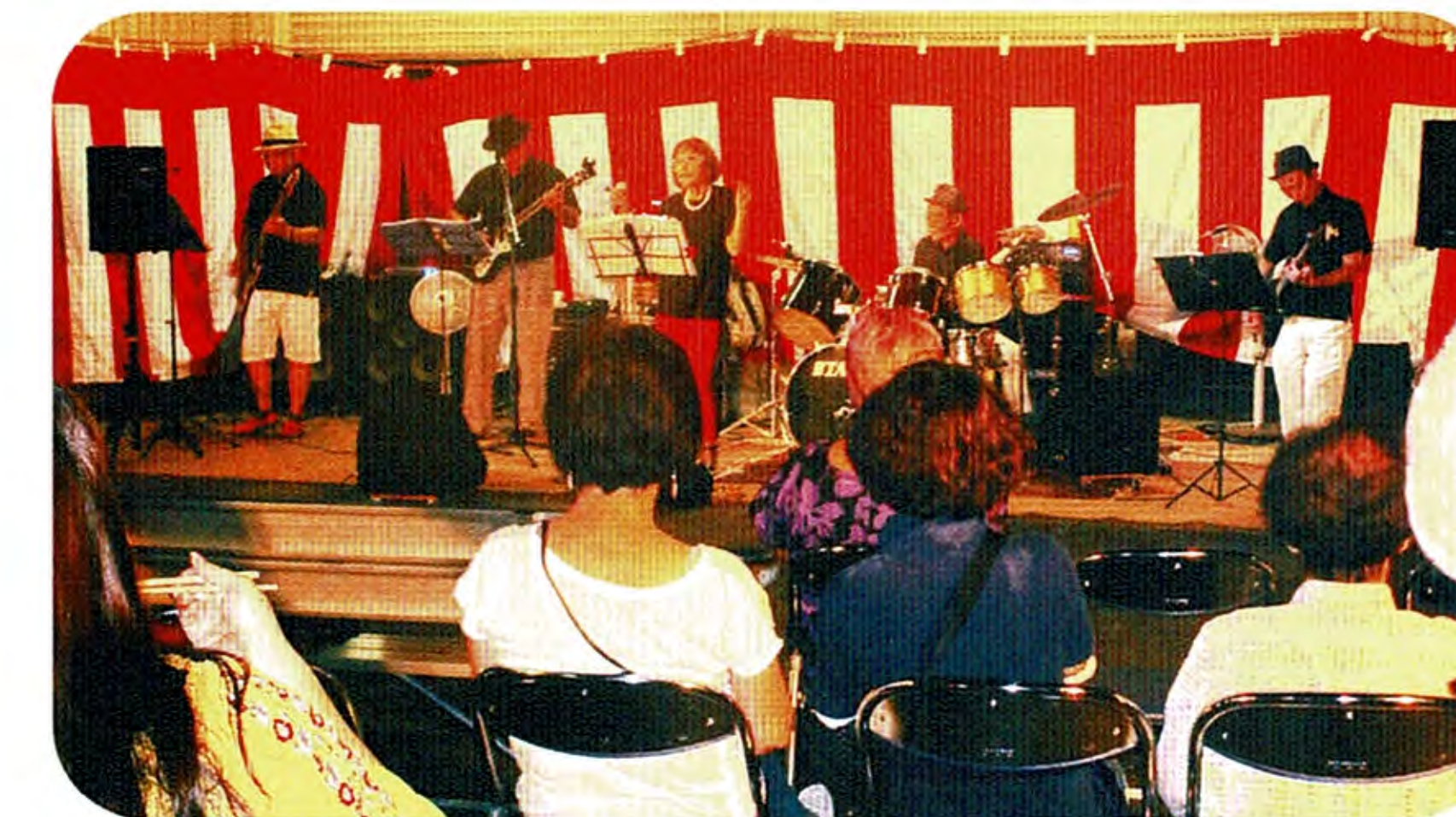
オヤジバンドによる、歌と演奏で楽しむ