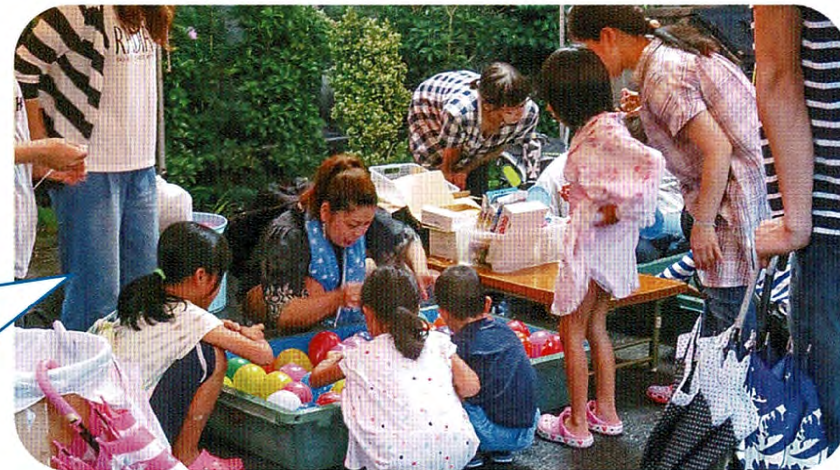
楽しんでヨーヨー釣り