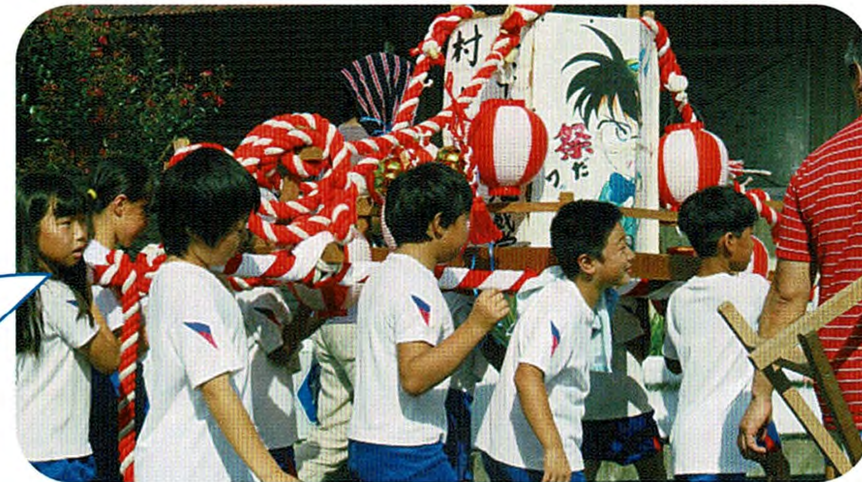
みんなで力を合わせ子ども神輿