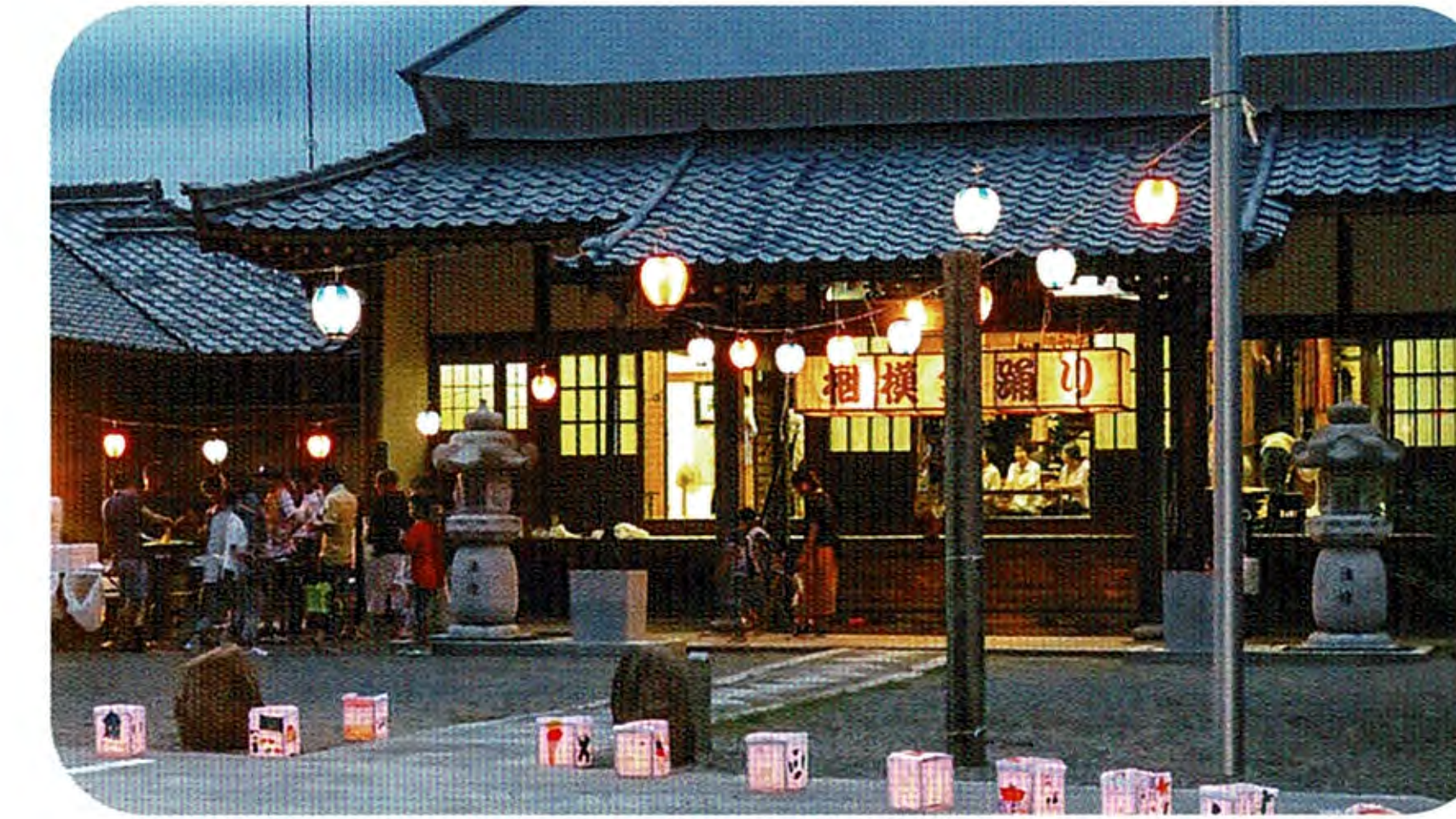
子ども達の手作り灯籠で地藏盆