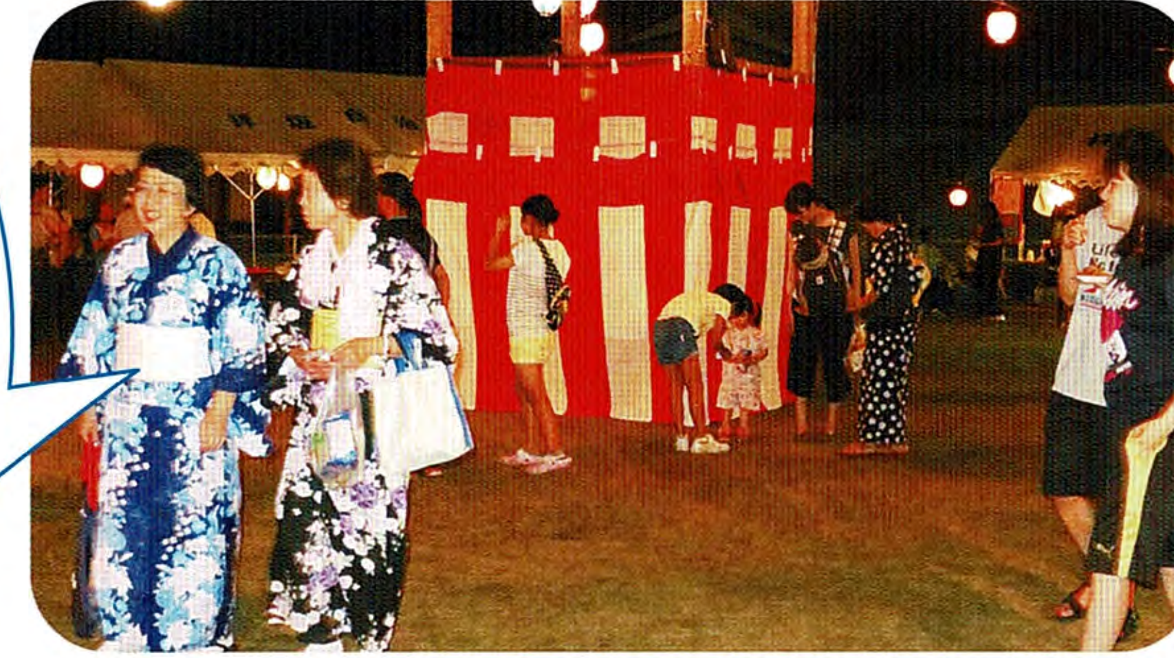
バッチリ！ゆかた姿で夏祭り