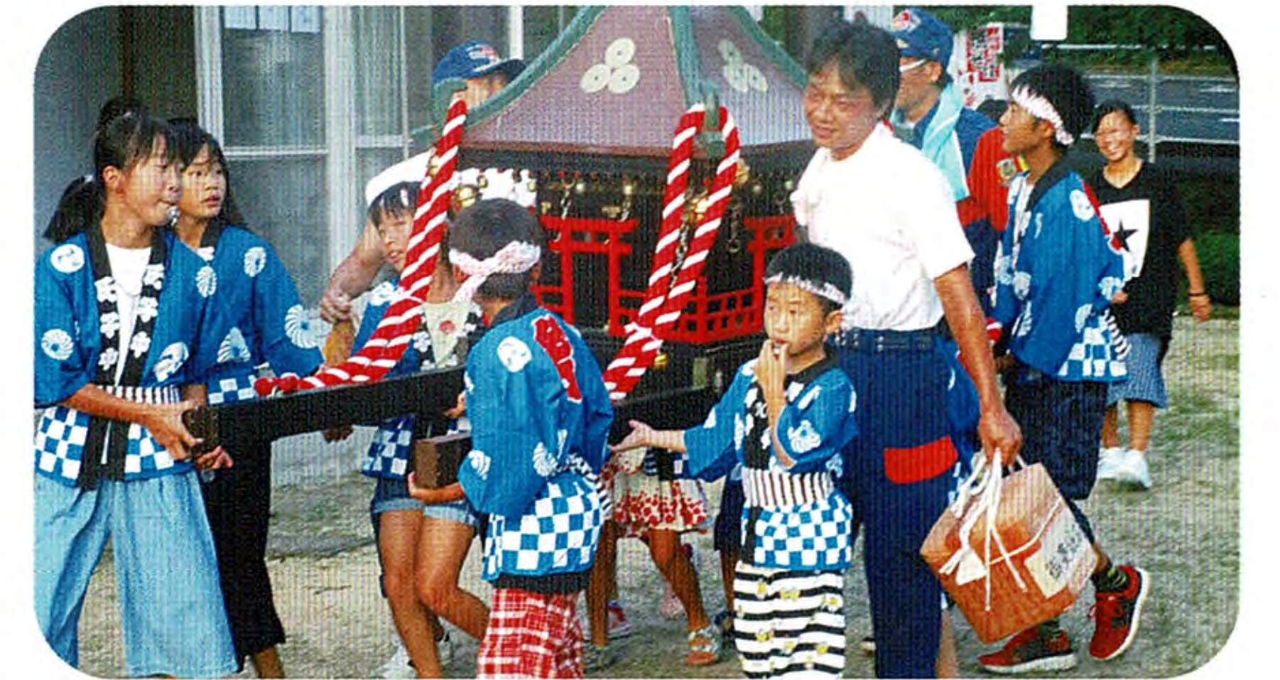
子どもたちは汗びっしょりで力を合わせ「ワッショイ・ワッショイ」