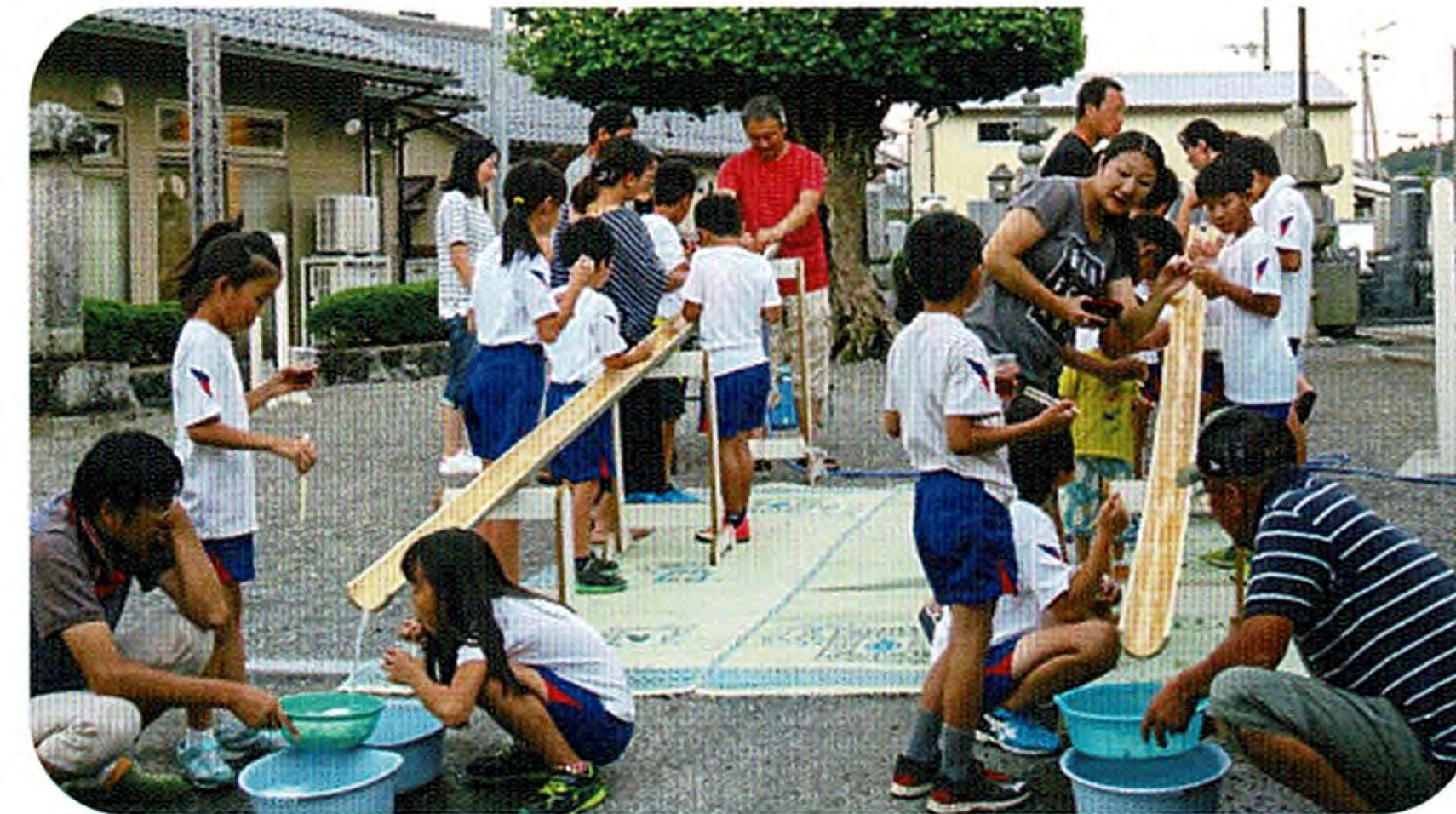
取れたぞ、食ったぞ、流しそうめん