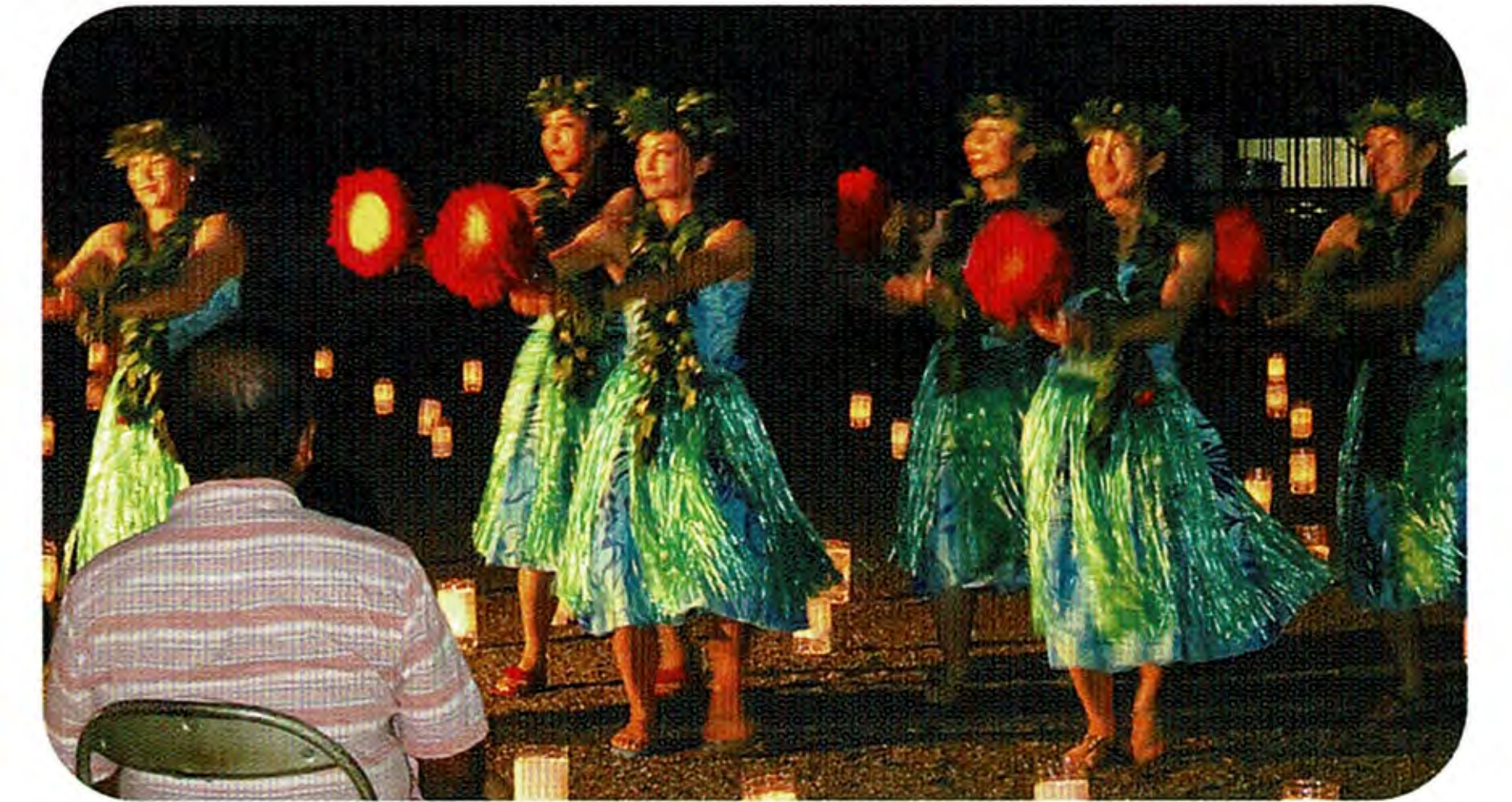
ハワイに来たみたい！