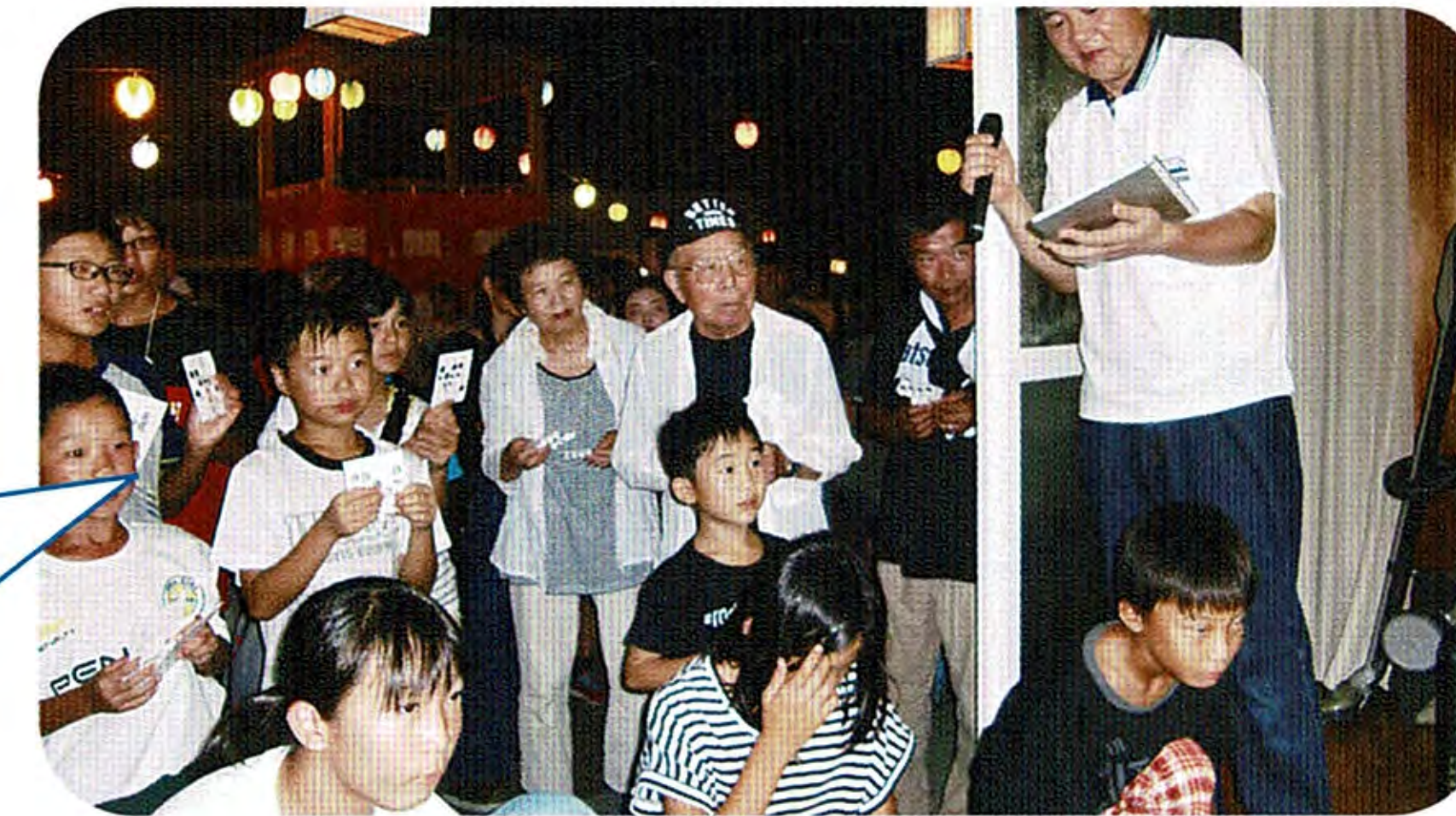
真剣なビンゴゲーム！