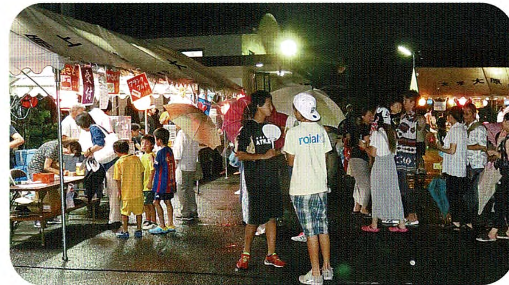
見てらしゃい！よってらしゃい！