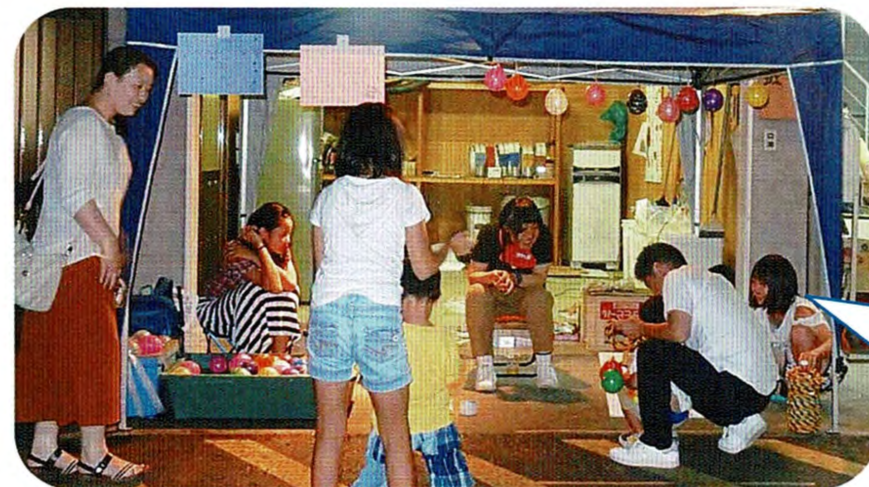
中学生もお店を開く