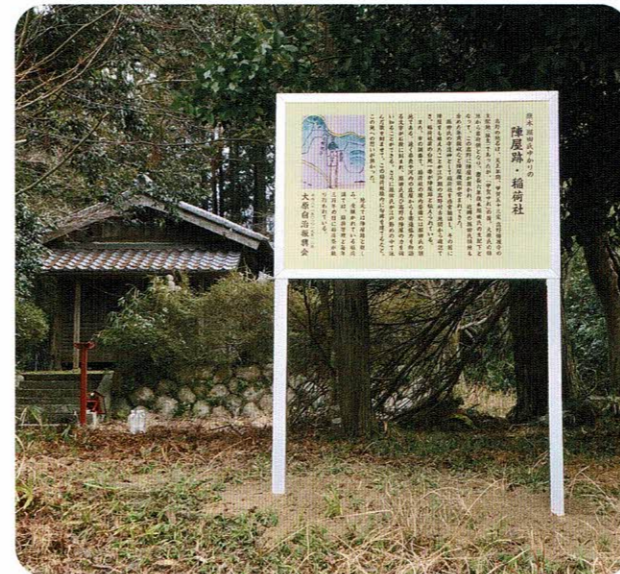
高野区の、旗本 堀田氏ゆかりの陣屋跡・稲荷社に史跡看板を設置しました。